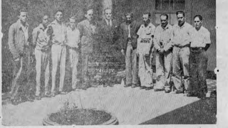
Nuestro ilustre jefe y candidato doctor don Rafael Angel Calderón Guardia acompañado de este valioso grupo de importantes agricultores de Villa Quesada de San Carlos, que ayer lo visitó para hacerle su adhesión.

Todas las fuerzas vivas del país están con el Calderonismo triunfante. Todos los ciudadanos que valen y que trabajan empeñosamente haciendo patria de verdad, vienen a nuestras filas para trabajar por nuestra causa, que es la causa de la República.